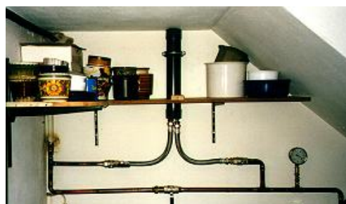
Installation après le compteur

L'Activateur installé sous de la conduite d'Eau: les branchements doivent être dirigés vers le bas