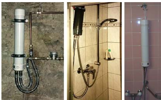
L'installation aisée dans la salle de bain

L'entrée (= « In ») et la sortie (= « Out ») du Revitalisateur d'Eau GIE® sont marquées. Les branchements sont de 1 pouce. Des pièces de réduction permettent d'adapter le branchement à la taille des conduites d'eau. Les conduites d'eau d'un diamètre supérieur à 1 pouce nécessitent des modèles plus grands. Le Revitalisateur d'Eau GIE® s'applique à l'eau froide et l'eau chaude.