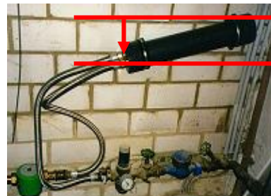
Montage incliné possible, avec les branchements toujours vers le bas